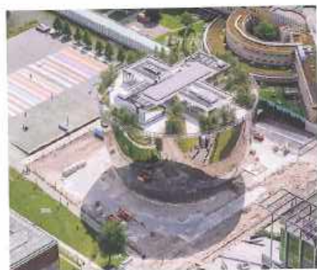
Verdwenen is de vestibule met fruitbomen – een van de drie sferen uit het oorspronkelijke ontwerp voor het Museumpark –, mede omdat de ruimte aan weerszijden van het depot te smal is om nog te spreken van een parkdeel.

van Brunier en OMA, is verdwenen – de ruimte aan weerszijden van het depot is gewoonweg te krap om nog van een parkdeel te spreken. Alleen het bord met Stadsgarage Museumpark dat boven de inrit hangt, verwijst naar een parkomgeving. De boomkruinen op het dak vallen weliswaar op, maar vanaf het maaiveld ervaar je die niet bepaald als park.