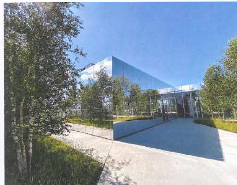
De daktuin met 75 berken. Het is de bedoeling dat 'dak en plein in elkaar overgaan', maar gelukkig voorkomt een balustrade dat.