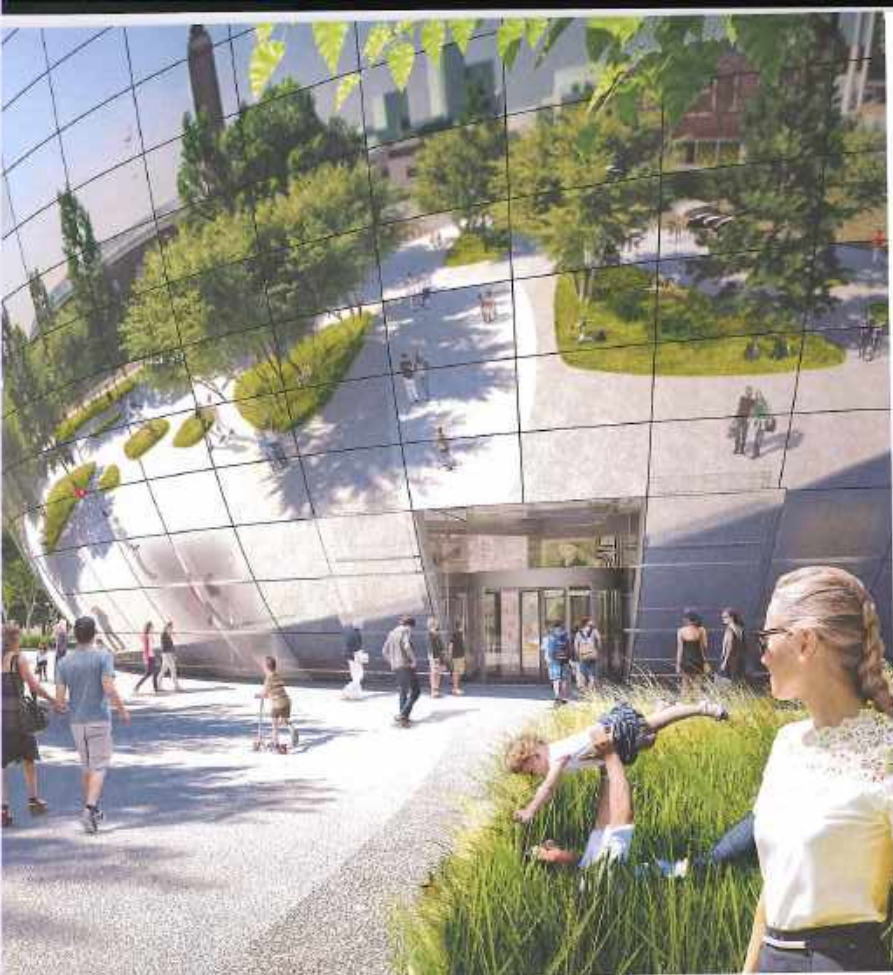
Als icoon geslaagd: MVRDV ontwierp een gestroomlijnde kom met een spectaculaire spiegelgevel.